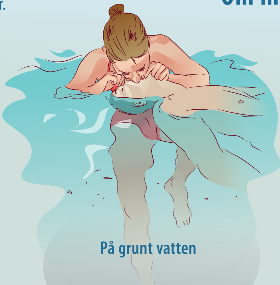
På grunt vatten

Behåll kontakten med larmoperatören tills ambulanspersonal tar över.